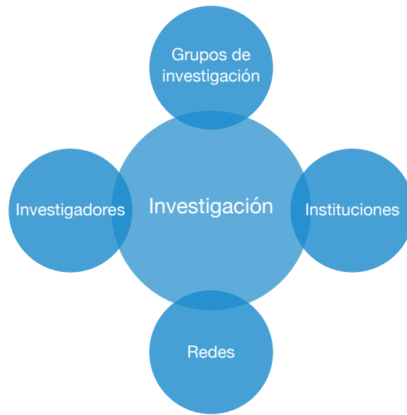
Figura 2. Estructuras en la que se puede organizar el proceso investigativo.

Los recursos económicos son pieza clave para hacer investigación; el Foro Ministerial Global para la Investigación en Salud señala que por lo menos el 2% del gasto nacional en salud y al menos el 5% de la ayuda para el sector salud deben estar enfocados en desarrollar capacidades de investigación (43); también plantea que hay que corregir la brecha 10/90 en investigación en salud, que hace referencia a que tan solo 10% de las fuentes de financiación en salud son usadas para hallar soluciones del 90% de los problemas de salud de la población mundial (44).